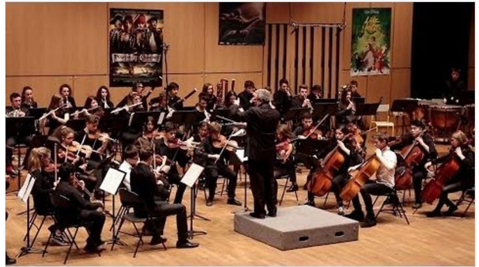
"Harry Potter" - musique du film - Orchestre des Benjamins du CRR de Paris (soundtrack)

Pambou CHEVAUCHEE-COSTAGLIOLA 5G https://www.youtube.com/watch?v=pFCZZolPLvM